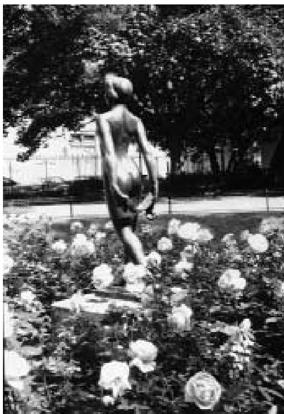
© Karima Berger.. Sqaure G. Cain, rue Pavée, Paris 2006

Durant des nuits d'insomnie, j'ai inventé une façon enfantine de m'endormir : je me parle tout bas et souvent ça marche. J'ai régressé, je suis une toute petite enfant. Je me couche et tout le monde dort avec moi. Rien de mal ne peut m'arriver. Tout est bon et suave. L'âme est éternelle. Jamais personne ne meurt. Dieu se répand dans mon corps : Sa douceur est goûtée comme un palais par tout le corps. C'est bon, c'est bon. Dieu m'illumine toute mais dans une pénombre afin que Sa lumière ne me réveille pas. Je suis une enfant, je n'ai pas de devoirs, seulement des droits. Le plaisir d'être vivante est celui de s'endormir... Mon âme s'abandonne enfin. Je n'ai plus rien à remettre. Rien ne me retient plus, je vais, je vais vers la béatitude. La béatitude me guide et me conduit par la main. La béatitude en vie. »