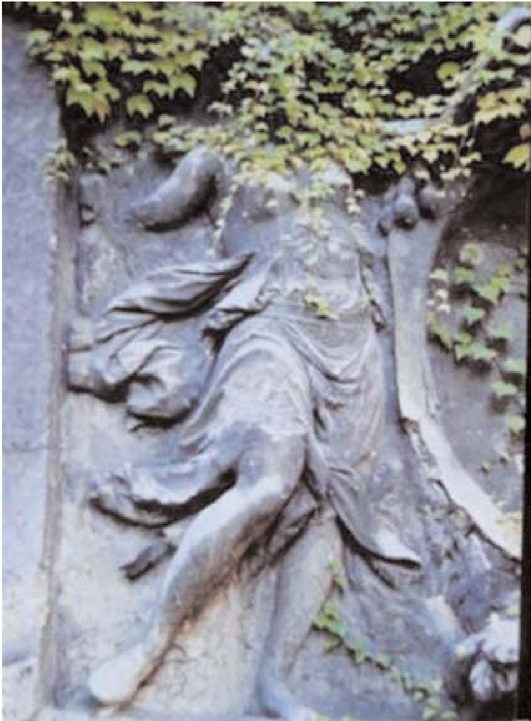
©Karima Berger. Maillol au square Georges Cain, rue Pavée, Paris, 2008