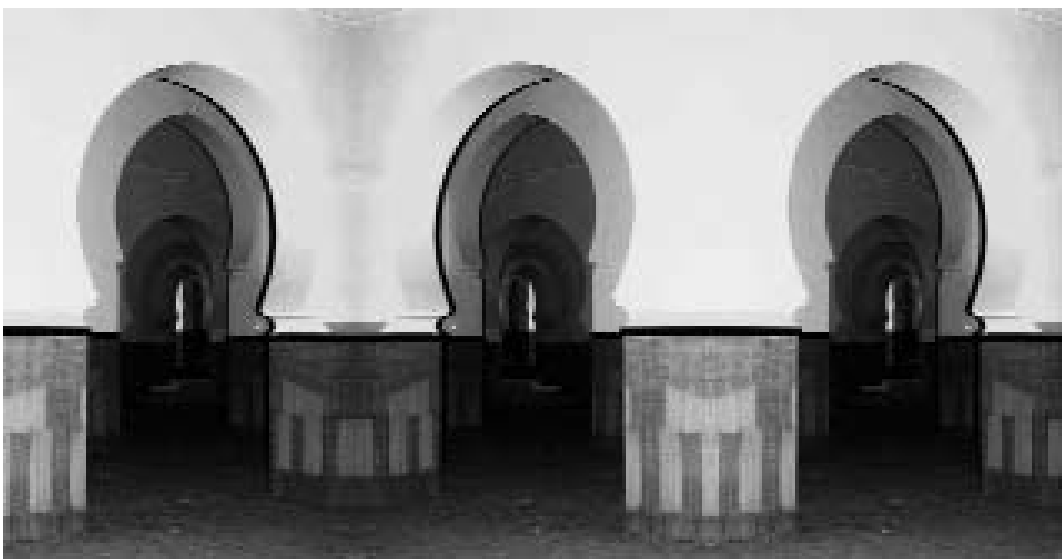
©Catherine Bendayan. Mosquée de l'Université de la Karaouine, Fès, Maroc, 2007

« Mon Dieu, les étoiles resplendent, les yeux dorment, les rois ferment leurs portes, chaque amant se retire avec son aimée. Et me voici, je demeure entre Tes mains. »