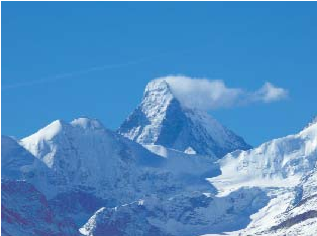
Le Cervin, Suisse, août 2007