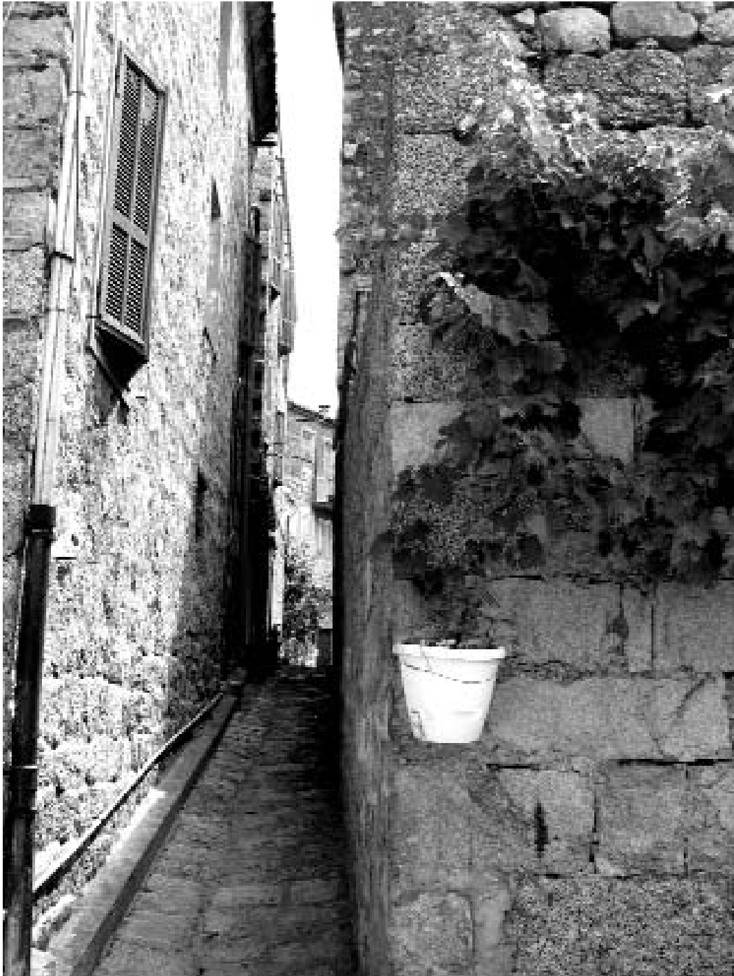
Corse, 2007