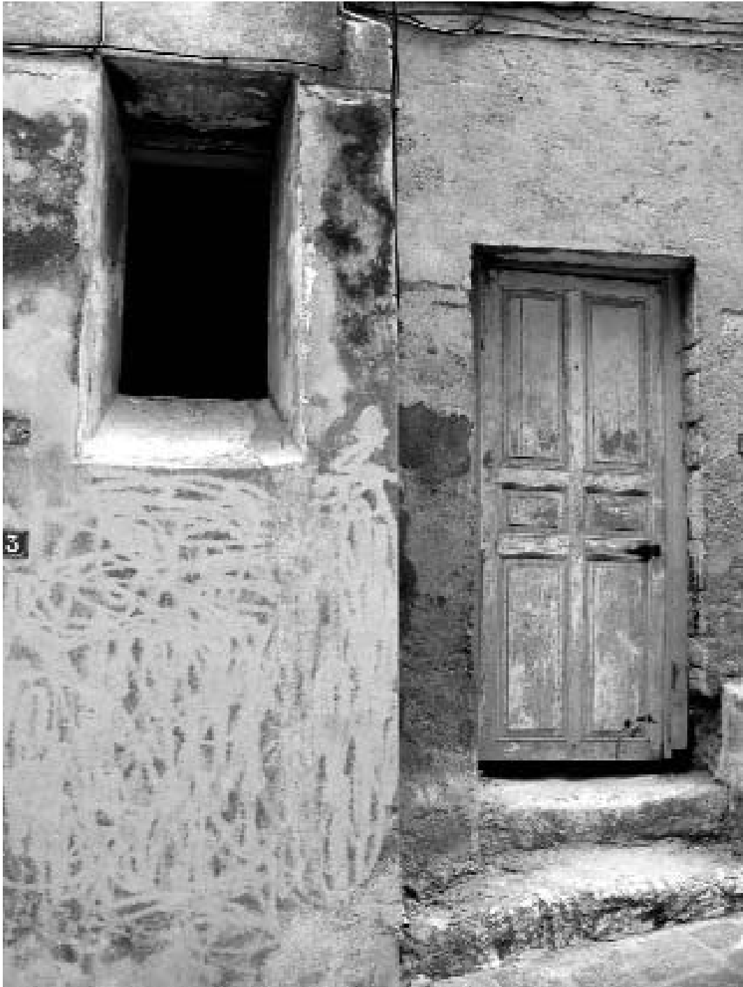
Corse, 2007