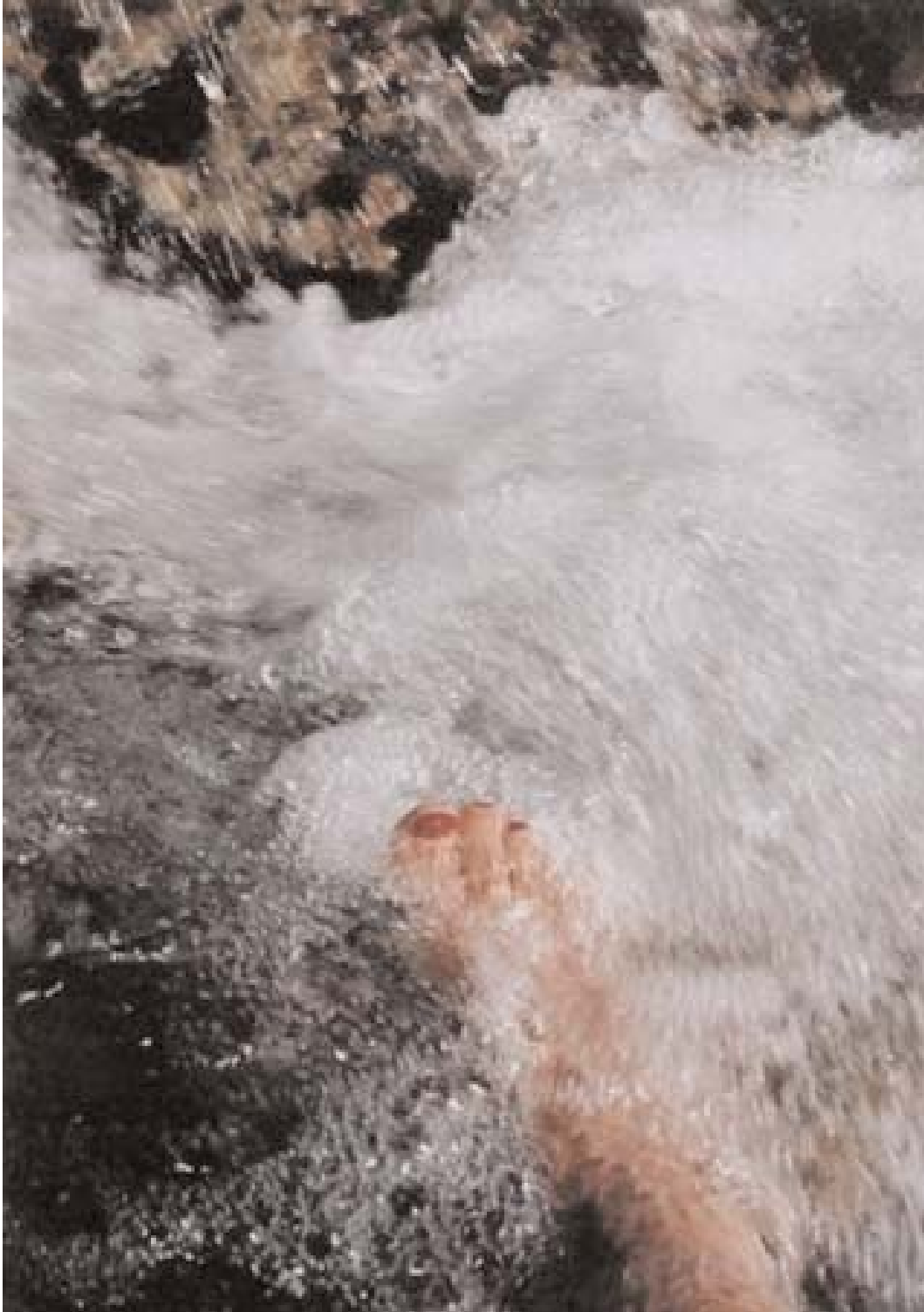
Torrent, Ponchette, Suisse, 2006