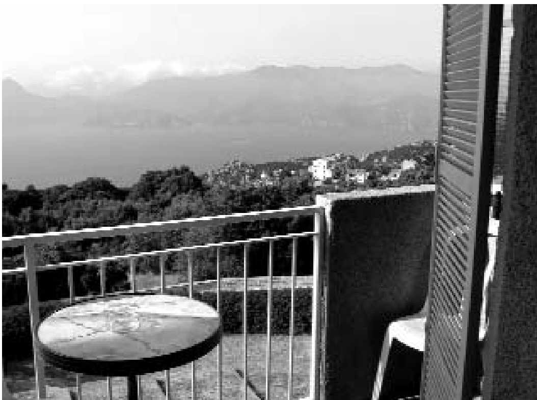
Corse, 2007

Et parce que la parole d'un sage hindou affirme que « l'on devient ce que l'on éprouve », après avoir exprimé l'amour et en avoir été blessées, les femmes l'ont caché, enseveli, plié avec soin et souci, tout au fond de leur être, entre le cœur et l'âme, allez savoir, et là, bien à l'abri, au cœur du cœur, dans « l'âme de l'âme », selon l'expression de Rûmî, elles l'ont protégé, fait grandir, et un jour, à force d'en vivre, parce que les femmes ont un pacte avec la sainteté, à commencer par la sainteté laïque, celle qui envahit toute vie de femme, le don de soi, l'écoute, l'aide, la main secourable, la bonté dans son exercice quotidien, un jour, elles deviendront cela, cette substance divine, à force d'incarner le verbe aimer, de Joséphine Baker à Mère Teresa, c'est toujours du cœur qu'il s'agit, là où le divin de l'être rayonne.