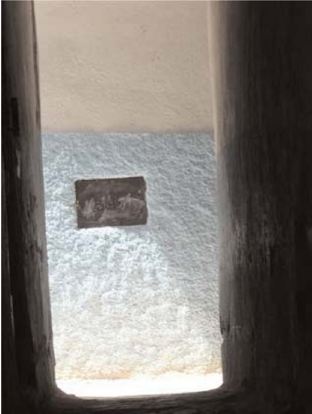
Seuil II, Fès, Maroc, 2008