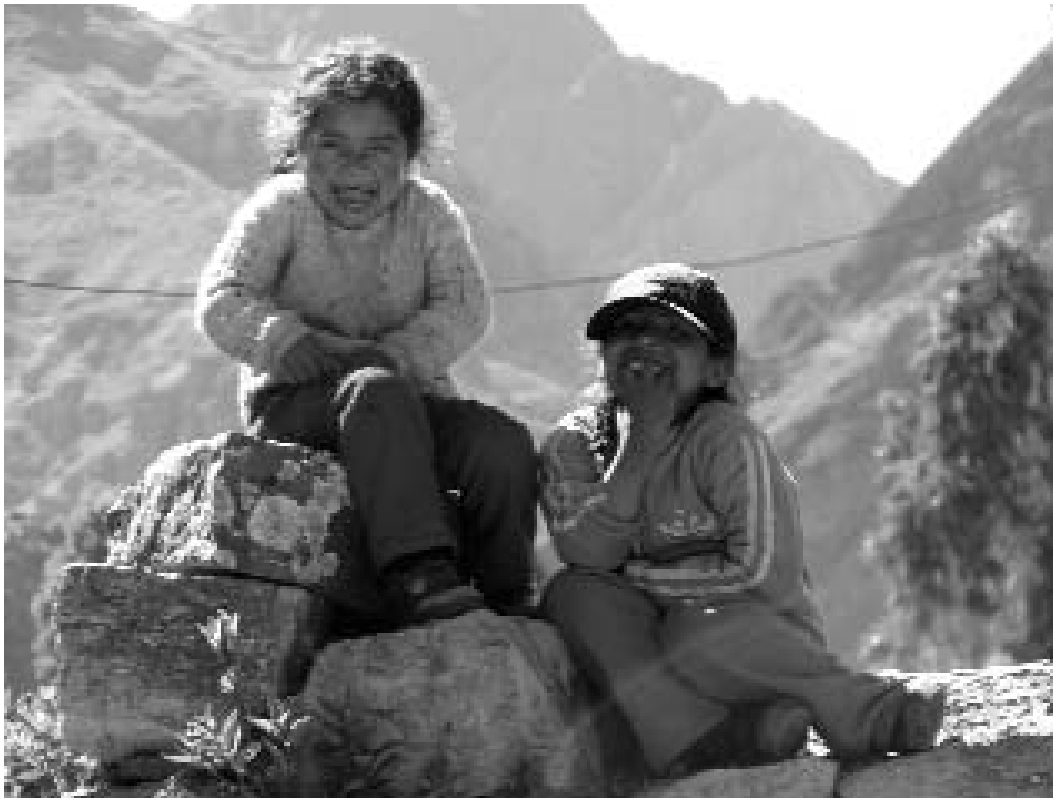
Fillettes, Péron, 2000