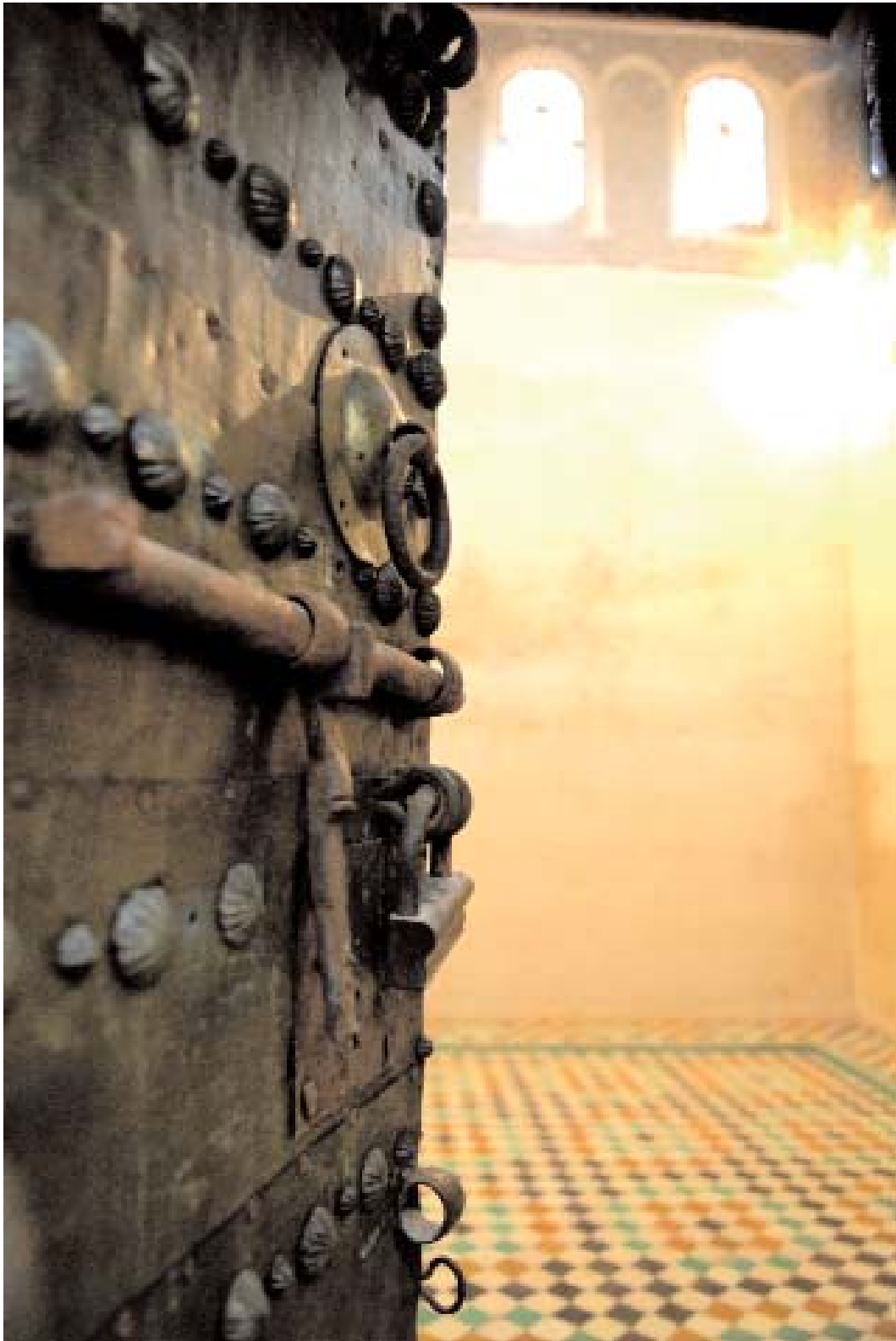
©Catherine Bendayan. Bibliothèque Karaouine , Fès, Maroc, 2008