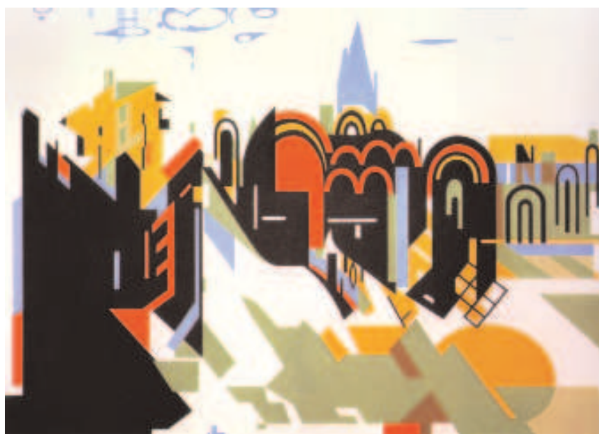
Nadir Afonso, "Place de la Gare", 1968-1978.

Sa peinture surréaliste nous montre hommes et femmes torturés par quelques affreux souvenirs, de la mélancolie, et de l'invention poéti-