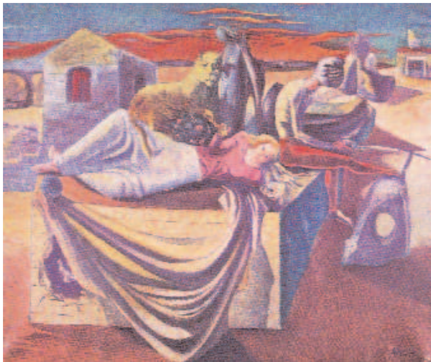
António Dacosta, "Amor Jacente", 1941.

"La ville de Porto aura toujours dans ma mémoire une place privilégiée. Elle fut pour moi l'initiation.