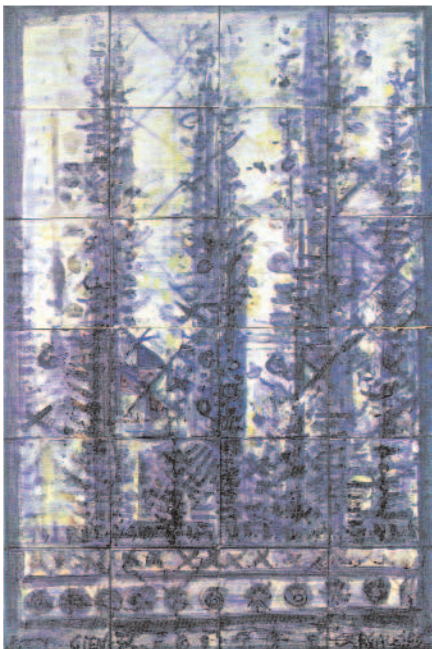
Manuel Cargaleiro, “Floresta Azul ao Amanhecer”, 1973